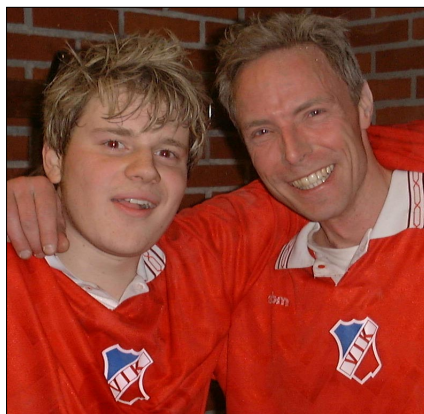
PopCorn & Wella, dom små änglarna, som fixade kvällen, med hjälp av Krutte Krutov.

Viggbyiterna pressades ner i sanddynorna under den 1:a kvarten. Men sedan Edet låtit giva den nu så historiska ordern. "Släpp ut Wella" så förändrades allt i ett slag. Som en vidbränd vessla for han runt i dynorna och jagade allt som rörde sig. Inget blev som förr. Viggan åt sig in i matchen och fick dom andra att framstå som övervinnerliga. Aldrig tidigare har redaktionen skådat en sådan uppvisning i kåranda och lagmoral som denna afton. Trots att Lillkentan understundom försvann i sanden var han som en uppretad tax som letade efter ben.