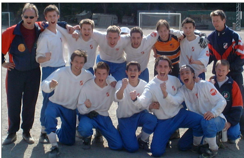
Här kan man snacka om solskenshumör. Återigen har vi visat att kämpaanda räcker långt.

En mer formidabel inledning på serien kunde man väl knappast ha önskat sig. Vinst från underläge i såväl B- som A-lagsmatchen visar på en enorm laganda. Vi ser fram emot en spännande säsong.