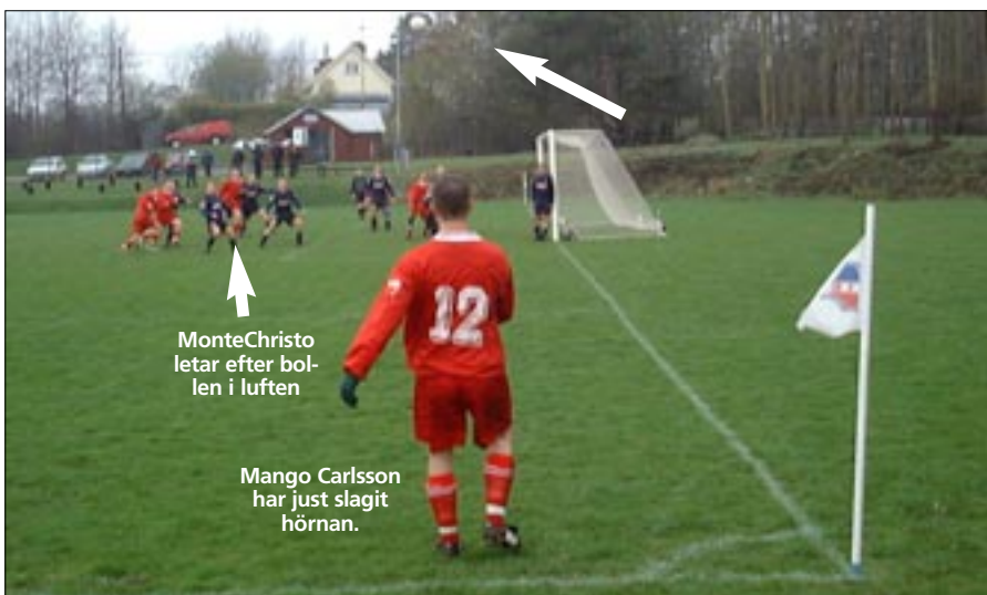
MonteChristo letar efter bollen i luften