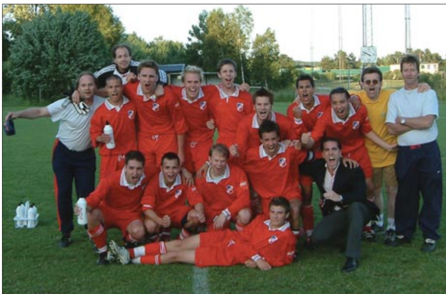
Här är grabbarna som gjorde t. Bästa spelet i år och så blev det dessutom vinst. Grattis!

Aldrig har väl en seger suttit så bra som just nu. Precis vad som behövdes för att vi skulle få gå till sommarvila med ett leende på läpparna. Åscans segermål i den 89:e minuten var värd mycket mycket mer än de tre poäng vi fick.