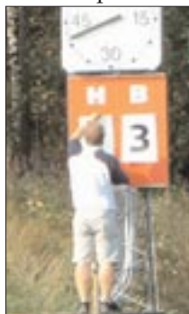
Äntligen, tänkte Edet

Med lite tur kunde kanske matchen ha utvecklats i en annan riktning som när exempelvis Zacce i den 35:e rullar