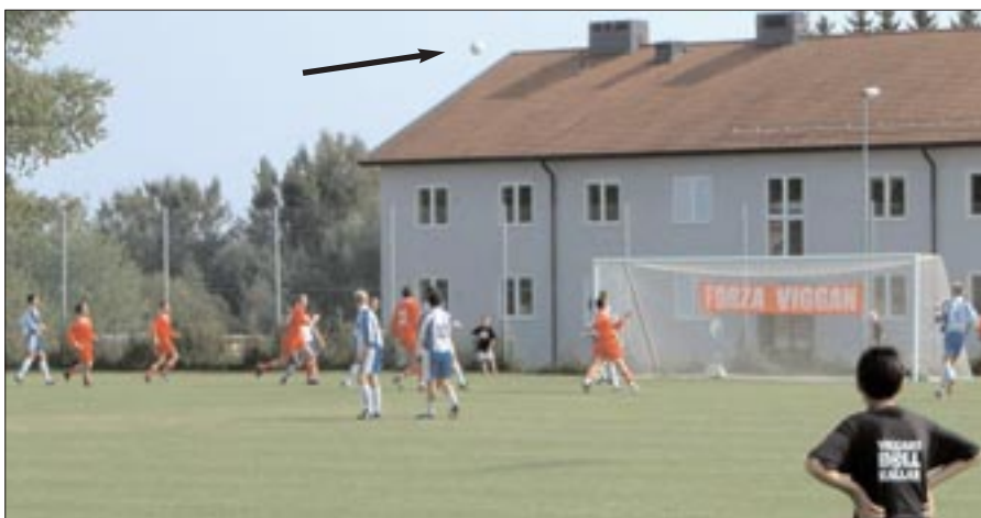
I den 26:e hade Mange en rökare i ribban som naturligtvis studsade ut. Vi måste få mer ribba in.

Undermåligt är ordet sa Bull, när man tittar på Viggans hemmastatistik. Två hemmasegrar hittills. Målskillnaden 2-11 mot Täby IS, Stockan och Viksjö får en onekligen att lyfta på ögonbrynen. Spelet mot Viksjö gav en del förklaringar.