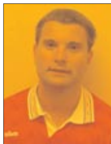
Mattan, helt utmattad

Tre minuter senare är Lillpastan helt igenom och öga mot öga med målvakten men skjuter mitt på. (Boormseffekten). Ett betydligt bättre agerande från viggbyiternas sida gör att andra halvlek ser mycket trevligt ut. Det är egentligen bara en