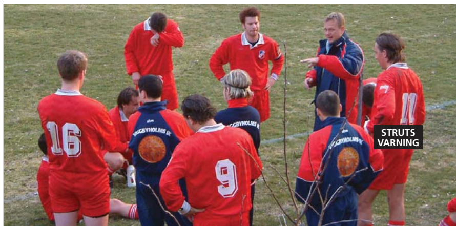
Mister DW har samlat lärlingarna inför den andra halvleken som också är den sista provningen innan den stora dagen på Annandag Påsk. Även denna gång lyssnade lärlingarna att döma av slutresultatet.

Långt upp i Norrland, bakom Estuna kyrka, samlades män från orten och 16 stycken från Viggbyholm för att göra upp om vilken serie som är bäst.