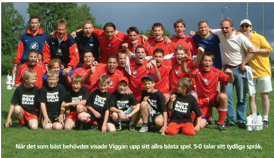
När det som bäst behövdes visade Viggan upp sitt allra bästa spel. 5-0 talar sitt tydliga språk.

När det som allra mest behövdes visade Viggan vad man går för. Denna seger var mer värd än vad man först kan tro.