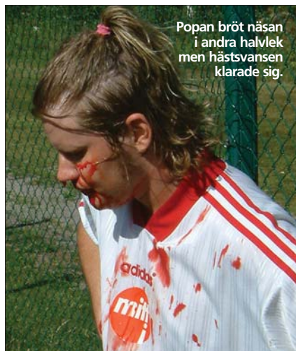
Popan bröt näsan i andra halvlek men hästsvansen klarade sig.

I den 28:e lägger Barbie II ett smörpass till kamraten Barbie I, som endast 2 meter från mållinjen ger den församlade publiken lite välförtjänt svalka genom det vinddrag som uppstod då Barbie I missar bollen. Sk-tanära var det. I den 30:e är Barbie I framme i ett bra läge igen, men skjuter över. Tre minuter senare antecknar sig Kulla för ett skott, som dessvärre gick över, men det såg farligt ut ändå.