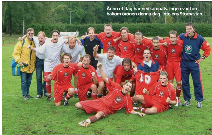
Ännu ett lag har nedkämpats. Ingen var torr bakom öronen denna dag. Inte ens Storpastan.

I den 9:e lägger Åskan en perfekt hörna (igen) som träffar Harry mitt i pallet och då står det givetvis 2-0 till Viggan. (Se bild på föregående sida.)