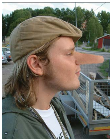
Pinoccio med sin 4 deciliter terylenebratwurst.