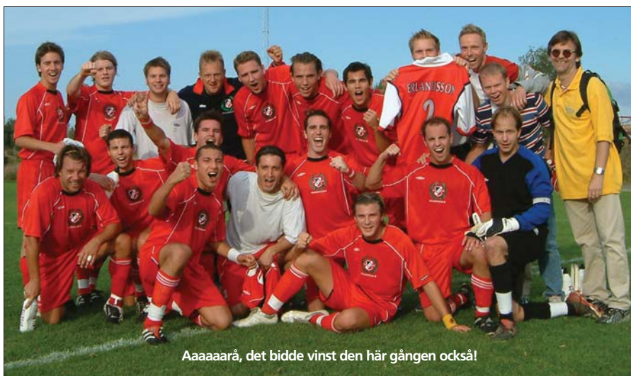
Aaaaaarå, det bidde vinst den här gången också!

I andra halvlekens 5:e minut serverar Lillpastan en synnerligen perfekt passning till Zacco som nickar in 1-3. Dessvärre drabbas Viggan av en försvarsdiarré i den 13:e varvid Bele