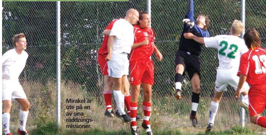
Mirakel är ute på en av sina räddningsmissioner.