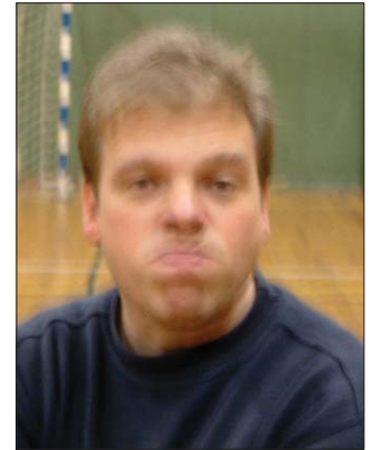
"AIK hockey är sämre än oss, så de så!" säger Edet bestämt.

Det fanns alltså inte tid till att spela "långsamt" om man ville att laget skulle göra mål. Redan i den första om-