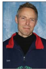
"I'll be back!"