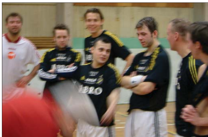
Observera hur Ölberg tjuvlyssnar på snacket i AIK efter matchen. Tunga miner över lag när Dubbelösskan säger: "F-n Edet, du lovade ju att vi skulle vinna med dom hära tröjorna". Lilltompa, Harry Boy, David, Blomman och Alex fattar bara nolla. "Nu är vi ju sämst i allting!" Edet har redan gömt sig.

Mer om Skinkcupen, tabeller, resultat mm på sista sidan.