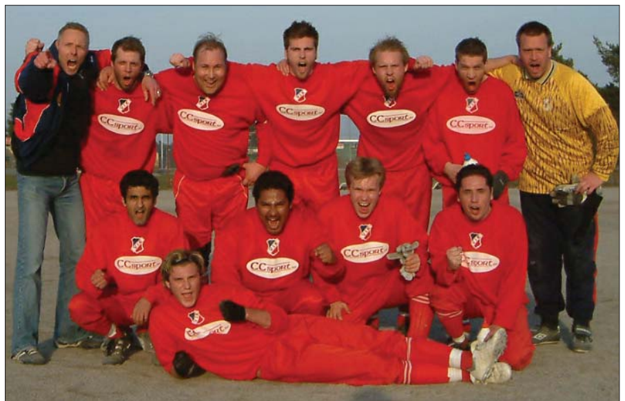
I rök och damm kämpade dessa heroiska ökenrättor (ej att förväxla med Solnastammen) och kunde trots underläge två gånger, tvåla dit Edsbergs IF med 3-2. Förra året fick Edsberg bita i gräset bägge gångerna med 4-3 och 5-2 i Viggans favör. Nu ser vi fram emot en repris i höst.

Nu gäller det bara att vi inte blir alltför styva i tuppkammen inför lördagens svåra bataljer, där lagen ånyo ställs på fötter så gott som samtidigt. Låt oss visa alla att det här inte var en engångsföreelse. Lycka till!