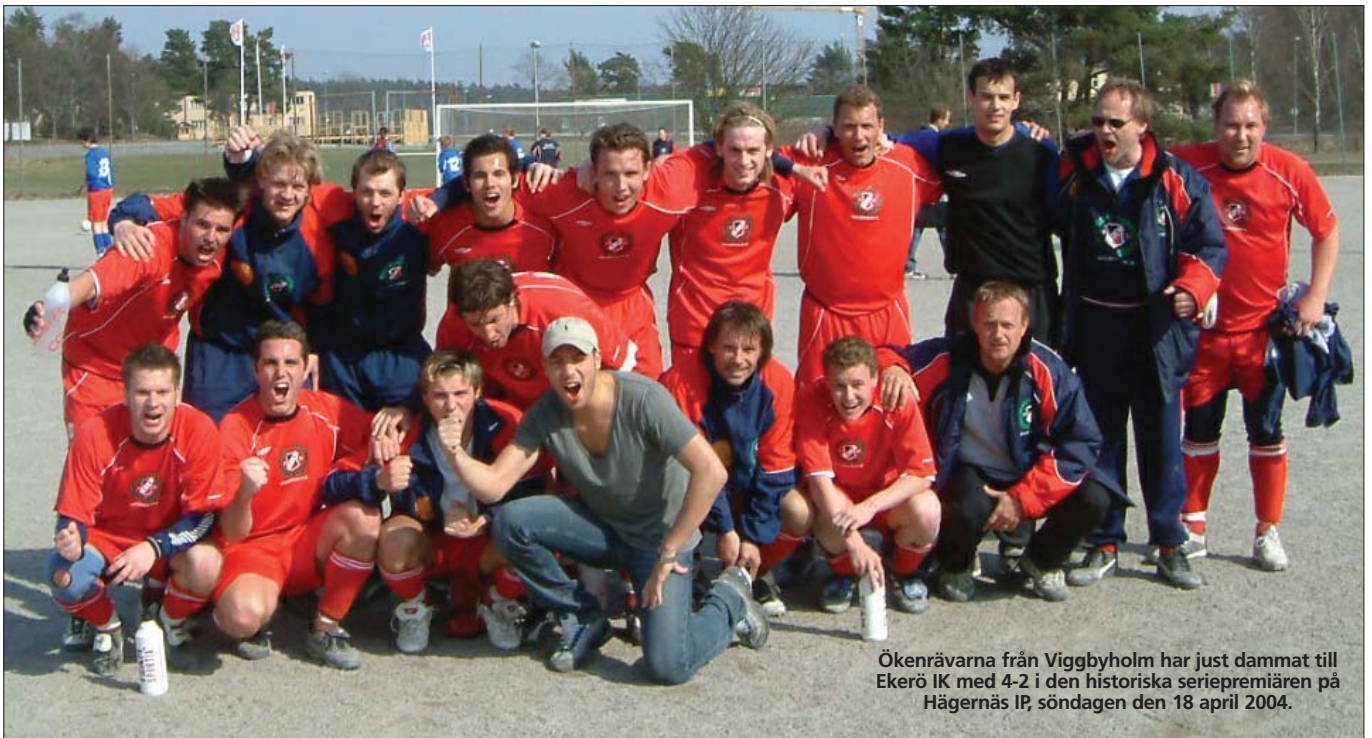
Ökenrävarna från Viggbyholm har just dammat till Ekerö IK med 4-2 i den historiska seriepremiären på Hägernäs IP, söndagen den 18 april 2004.