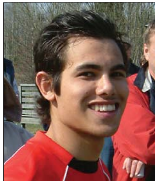
Gylfen blev med sitt mål i den 26:e minuten historisk genom att göra Viggans allra första mål i div 4.

I den 31:a välter den seratlige Zacco på högerkanten och tilldöms frispark, som han enligt bilden skjuter direkt in i mål utan att nån hann fatta nåt. Zacco hade sedan ett par feta chanser till.