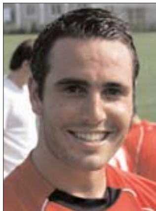
Aaarå, Maxen bröt måltystnaden i 49:e min i den femte matchen. "Inge sk-t, det vet du" sa Maxen.

Viggan hade gjort sitt första mål på 6 timmar och 49 minuter (409 minuter!!!!).