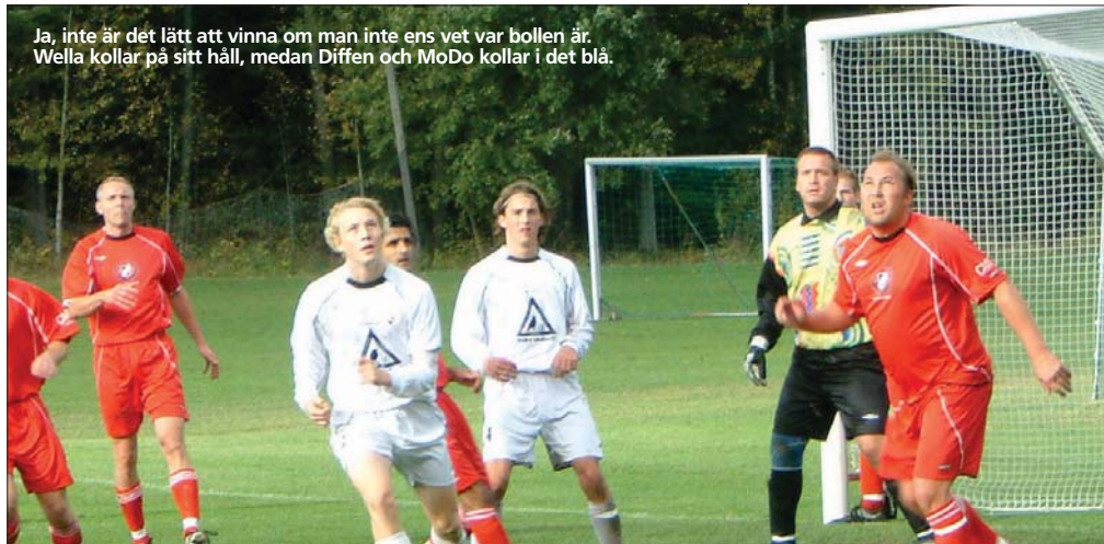
Ja, inte är det lätt att vinna om man inte ens vet var bollen är. Wella kollar på sitt håll, medan Diffen och MoDo kollar i det blå.

Egentligen finns det inte så mycket att orda om sista matchen mot Edsberg. Vetskapen om att Turebergarna redan hade vunnit serien tog nog en hel del vind ur gomseglan. Men vi gör ett försök. Krutov låter sin högerväffla tala i den 6:e minuten då han medelst en frispark så när kunde ha fått in den, om den gått lite mer till höger. I den 9:e blir det 1-0, lite snopet. I den 30:e räddar Diffen ett friläge, för