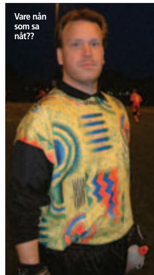
Vare nån som sa nåt??

Som vanligt när Viggan spelar, så är det ofta vi som bjuder motståndarlag på målchanser. Denna match är inget undantag. Slår vi en felpass, så hugger dom direkt och Diffen får torka svetten ur pannan allt oftare. I den 19:e minuten hör man Diffen säga. "Luuuugnt". Han sätter orden i halsen, då han märker att en Akropolis fak-tiskt hinner upp en boll, som är på väg att rinna av konstgräset.