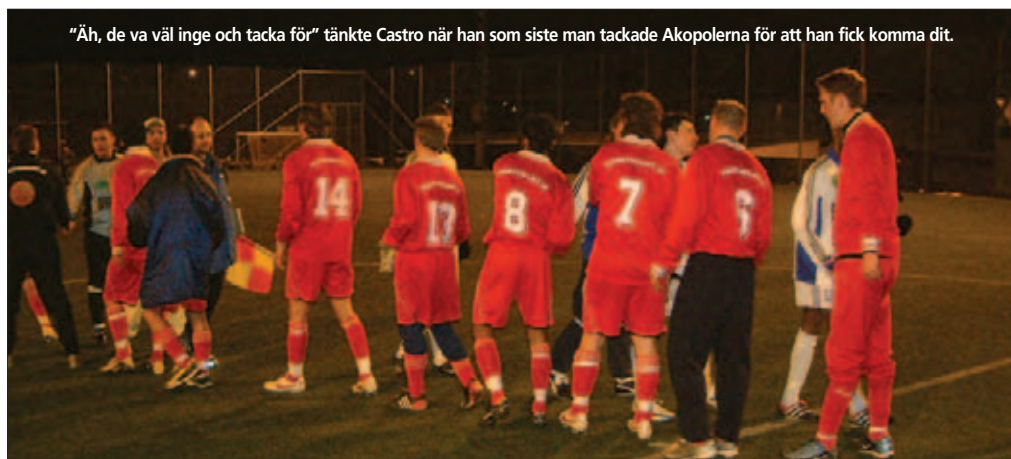
"Åh, de va väl inge och tacka för" tänkte Castro när han som siste man tackade Akopolerna för att han fick komma dit.

får Blomman fram bollen till Gonne, som drar på med sin Haubitzer (vän-sterfoten) på volley. Skottet stryker målvaktens högra kryss. Nära.