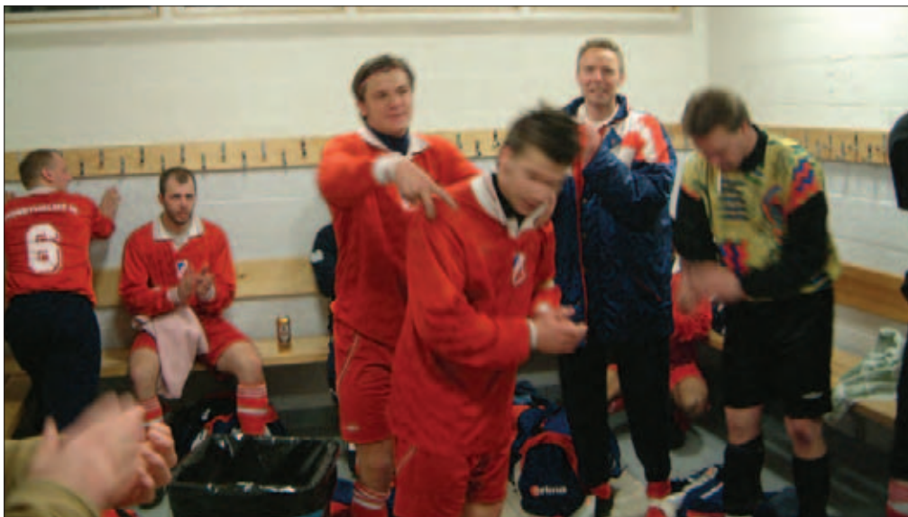
Efter alla handskakningar efter matchen fick t o m Danilo ont i handen. Lillpastan poängterar ytterligare med teckenspråket att han gjorde två mål. Blomman verkar ha gått in i väggen eller så har han nåt annat på G, medan de övriga fortsätter att applådera för fullt.

mar skulle ta fart. Försäljningsaktien steg ytterligare fyra punkter, då Akropolis gjorde 2-0 endast 3 minuter efter sitt ledningsmål. Målet försiggicks av ett passivt icke-gå-på-skytten-taktik, vilket ledde till att det rasslade till i Diffens vänstra kryss. Onödigt snyggt.