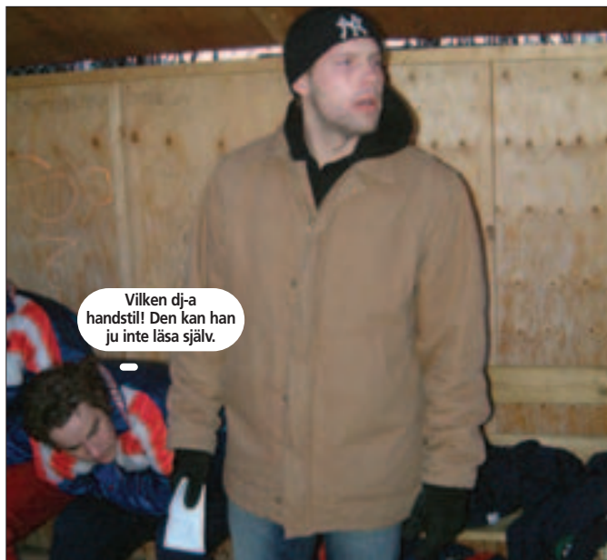
Vilken dj-a handstil! Den kan han ju inte läsa själv.

Den flygande reportern Krutov kan inte slita ögonen från matchen, men det kan lille Julle, som i krystställning är sk-tnyfiken på vad Krutte har antecknat från matchen.