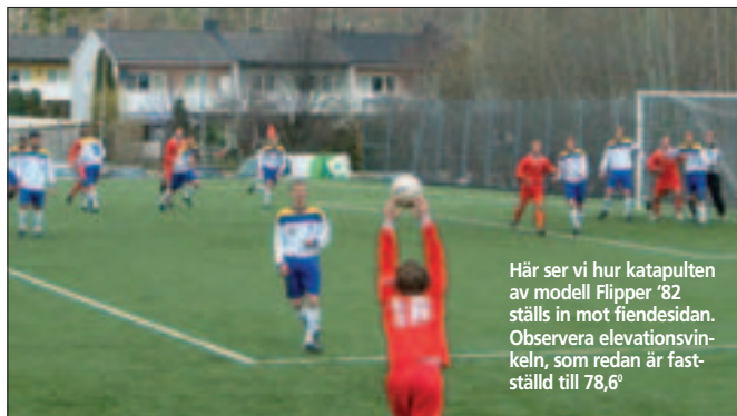
Här ser vi hur katapulten av modell Flipper '82 ställs in mot fiendesidan. Observera elevationsvinkeln, som redan är fastställd till 78,6°

Efter några försök av KA, Nordinen, Kennie så är det dags för dagens klo. Flipper (se bild) gör ånyo ett maratontkast som når till bortre stolpen där Joker väntar