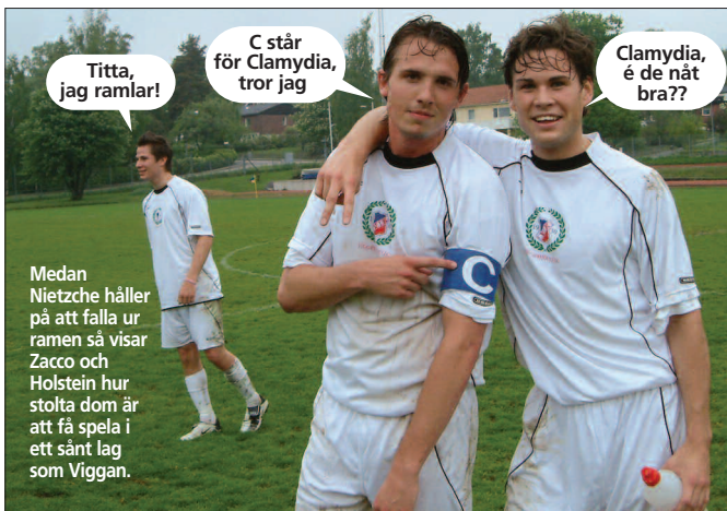
Medan Nietzsche håller på att falla ur ramen så visar Zacco och Holstein hur stolta dom är att få spela i ett sånt lag som Viggan.

att man maximalt slår en sådan volley vart 10:e år. Men skam den som ger sig. I den 29:e lägger Danilo ett pass till Ilex som slår ut den på vänsterkanten, där en frustande Zacco höres komma. Zacco vickar lite på rumpen så att han lurar bort