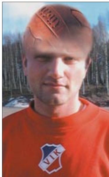
Redan som liten hade Rollo Bollo mycket boll i sig, vilket bl a ledde till att han alltid hade för mycket luft i sig som han var tvungen att göra sig av med.