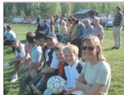
Bland den 96-hövdade publiken fann vi detta bildbesvis på att det finns massor av små-Edetar. Från vänster: Lilla Edet, Mini Edet, Lill Edet och Fru Edet. Och alla log mot kameran.

Blott sekunder senare springer den länge igenom men skjuter den här gången mitt på mållisen. Efter tvenne hörnor i den 33:e, där en av dom hamnade i ribban, vilket kan ses på bilden till vänster, sköt Zacce 8 cm utanför.