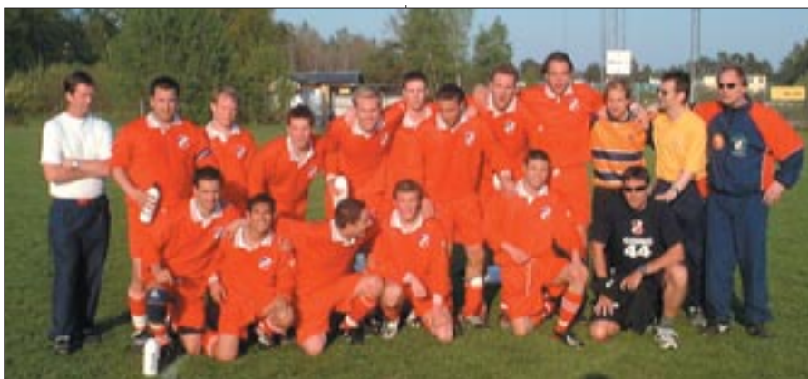
Här är grabbarna som nästan skrämde sk-ten ur publiken under 75 minuter. Men 15 min räcker.