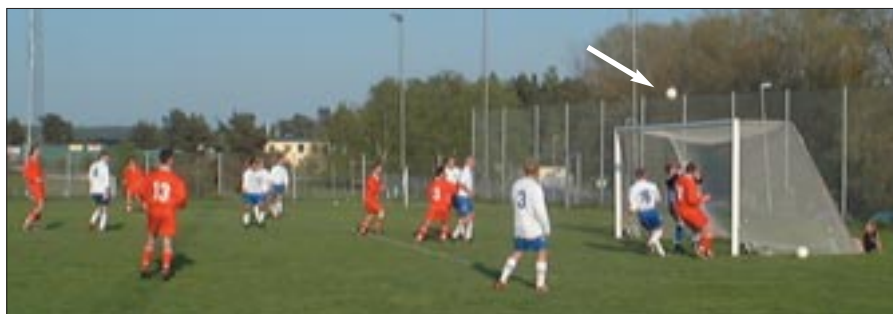
Vi befinner oss i den 33:e minuten och vi har just haft ribbträff efter en giftig vänsterhörna. På returen är Zacce den Långe där och skjuter 8 cm utanför till höger. Påpasslig fotograf va?

Sen hände inte mycket annat än att Mirakel räddade en boll innanför mållinjen i den 43:e. Sen var alla glada.