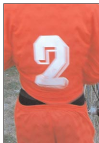
“Det var tvåan” tyckte domartrion