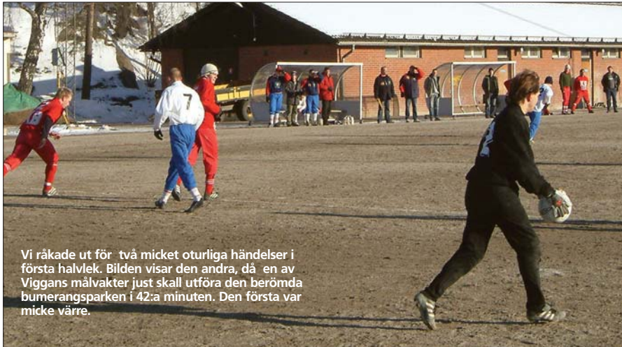
Vi råkade ut för två micket otyrliga händelser i första halvlek. Bilden visar den andra, då en av Viggans målvakter just skall utföra den berömda bumerangsparken i 42:a minuten. Den första var micke värre.