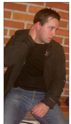
Isac fick nypa sig både här och där efter matchen. "Är jag verkligen så här bra egentligen?"

Och så bidde fallet. Redan efter fem minuter hade ytterligheterna i Viggan, i meter mätt, skapat förutsättningarna för en reduktion, vilket också skedde. De vita hade nu spelat upp sig och de flesta kunde nu agera utan nothäften, vilket man dock borde haft i den 17:e, då KB:arna petade in 3-1, efter ett snyggt flipperspel. Kändes dock helt fel, med tanke på hur samstämda de vita hade blivit. Fem minuter senare, fortfarande yr i mössan, kunde Åskan ha fått in ett reduceringsmål men så skedde icke. Maxen hade även han ett fett tillfälle då han pricksköt på ett rött ben (åtminstone bör det ha blivit det) som stod på mållinjen. Matchen slutade sålunda 1-3, men efter en mycket bra andra halvlek så kunde de siffrorna ha blivit betydligt jämnare. Nästa gång gäller det Tissarna, men då är vi redan vana vid grus.