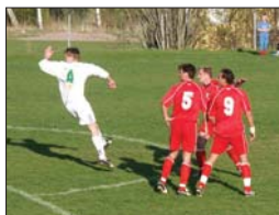
Norden och Freden har just pulat klart med frisparken och Rosens skott är nu på väg in i mål. Snopen back!?

N&F petar och Rosen sköt direkt i mål och Krutov fick återigen springa och hänga upp en nuffra på resultat-tavlan. Denna gång en 4:a, dvs nu 4-0.