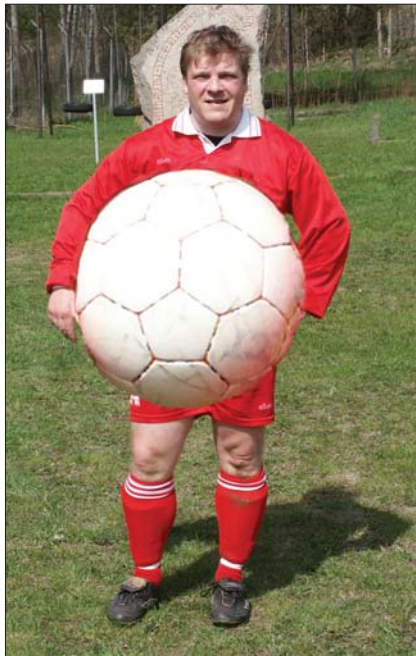
Viggen B-lag var alltför små i matchen mot Råsunda, vilket Edet upptäckte när han kom in.

Hursomhelst, här är lite om vad som händer: