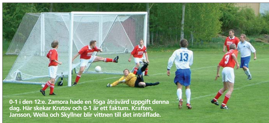
0-1 i den 12:e. Zamora hade en föga åtråvärd uppgift denna dag. Här skekar Krutov och 0-1 är ett faktum. Kraften, Jansson, Wella och Skyliner blir vittnen till det inträffade.

IFK kunde ha fått några strutar till, men det kunde ju även vi ha fått. Ett svettigt tillfälle var i 7:e då Krutov räddar på mållinjen. Coach, som under match går under epitetet TinTin, får i den 10:e iväg en riktig rökare som dessvärre slicar just över krysset.