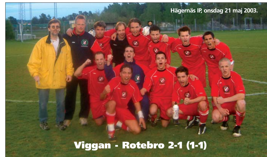
Hägernäs IP, onsdag 21 maj 2003.

Efter ytterligare en gastkramare lyckades Viggan vält Rotebro IS över ända, men det satt återigen långt inne. 2-1 dock.