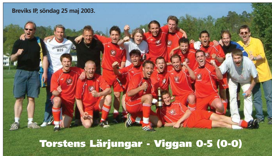
Breviks IP, söndag 25 maj 2003.

Målexplosion i andra halvlek och en extraordinär insats mot Tottes gav Viggan fjärde raka segern och därmed serieledning.