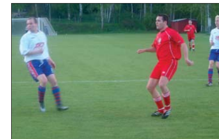
Maxen är riktigt nära i den 46:e men är för lös.

Riktigt hett blir det först i den 46:e då Maxen glider igenom på vänsterkanten och kommer inom höravstånd till mållinjen. Maxen lägger dock av en alltför löös boll för att det skall räknas.