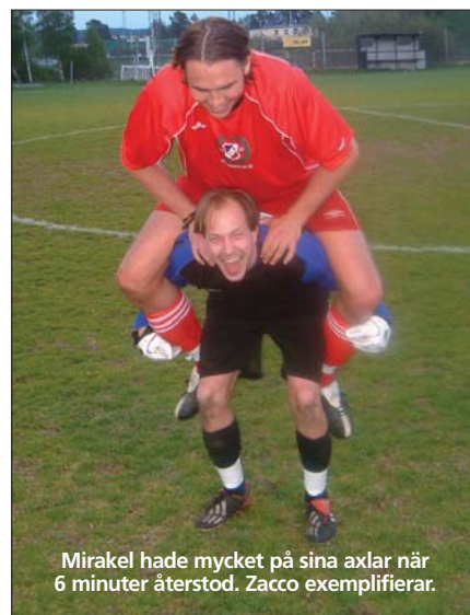
Mirakel hade mycket på sina axlar när 6 minuter återstod. Zacco exemplifierar.

I den 39:e faller en Rotis på ett elegant sätt men på fel ställe. Straff. Mirakel räddar skottet och returen går ut. Puh!! I den 40 är Dubbelösskan fri men orkar inte skjuta i mål. Fyra minuter senare har Viggan ett kanonläge att måla efter jättejobb av Dubbelösskan. I den 47:e är Gylfen helt fri med målsen men skjuter mitt på. Nu har vi fått ihop en hel strutsfarm. ☐