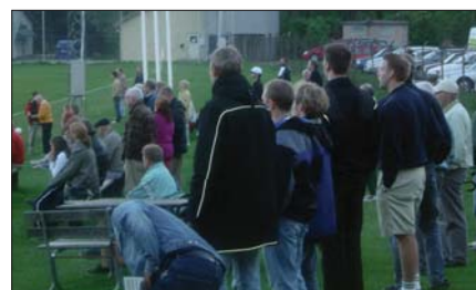
När 6 minuter återstår säger en av åskådarna på bilden: "Jag känner på mig att det blir mål för Rotan snart." 30 sekunder senare faller nr 2 i Viggan en Rotis, sk Rotvälta, varvid straff utdömdes. Men Mirakel räddar straffen förstås.

Mackan som nu börjar ta för sig, har i den 35:e tillskansat sig en position nere vid vänstra hörnflaggans förlängning in emot målet, och skickar in en passning där bollen går i ribban och glider ca 4 dm utmed densamma innan den går ut i Universum.