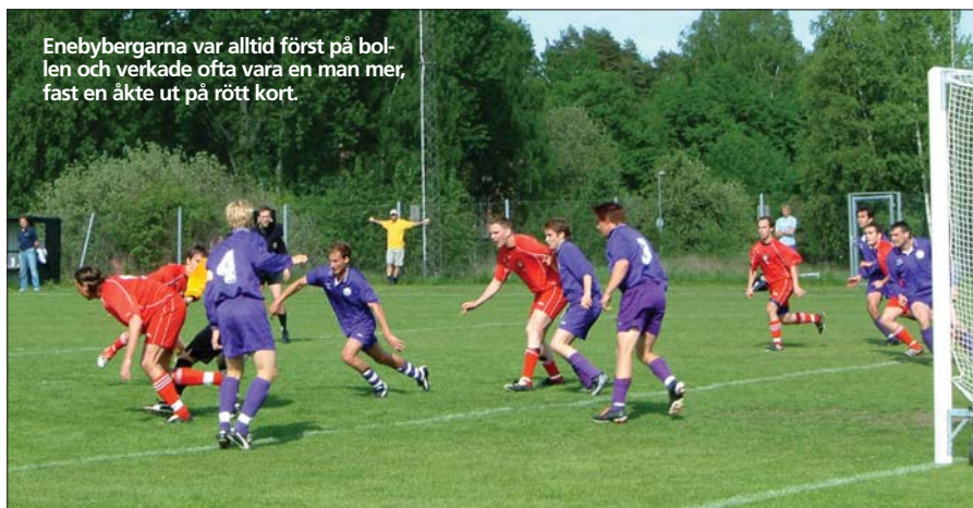
Enebybergarna var alltid först på bollen och verkade ofta vara en man mer, fast en åkte ut på rött kort.

Trots ledning med 2-0 och bländande spel tappade Viggan greppet efter en halvtimme och släppte in Berget i matchen.