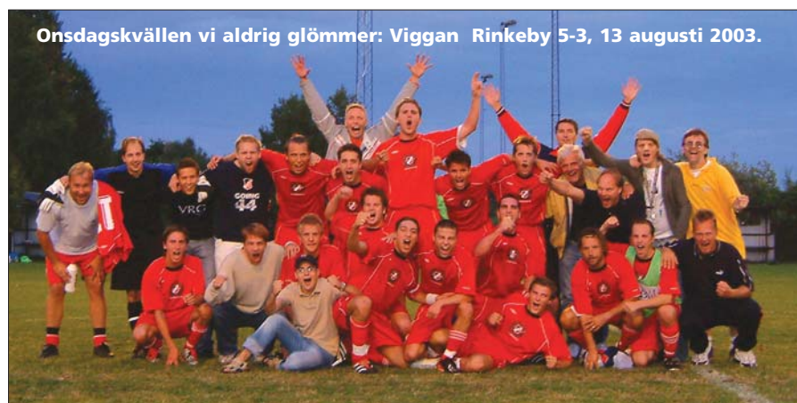
Onsdagskvällen vi aldrig glömmet: Viggan Rinkeby 5-3, 13 augusti 2003.