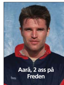
Aarå, 2 ass på Freden

Sen var det pausdags. Sen hände just inte mycket annat än ett evigt duttandes med bollen i mitten syntes det. Men i den 17:e vaknar Mirakel till och tvingas göra en av sina berömda