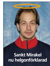
Sankt Mirakel nu helgonförklarad

I den 27:e får Mirakel göra skäl för namnet igen och lyckas freda målet i den första anfallsvägen och på returen tar skottet i stolpens utsida. Puh igen!