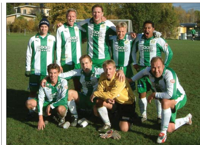
BRONSMEDALJÖRERNA I LILLA VIKING CUP 2003: HIF.