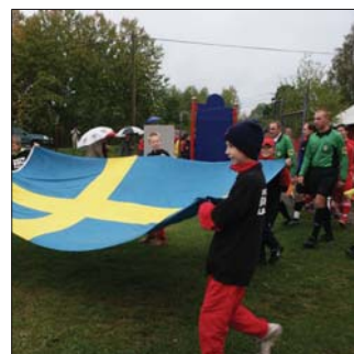
Den häftiga inmarschen.

Lördagen 4 oktober, 2003 En timme innan matchstart öppnade Sankte Per gylfen och lät det skvala för den återstående delen av lördagen. Trots denna ovälkomna påhälsning uppifrån så letade sig inte mindre än 103 personer ner till Hägernäs för att få se sina idoler i aktion. Inte nog med det, de fick se Sven Tumba dela ut en gratifikation på 3000 kr från Supporterklubben.