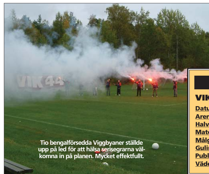
Tio bengalförsedda Viggbyaner ställde upp på led för att hälsa seriegrarna välkomna in på planen. Mycket effektivt.