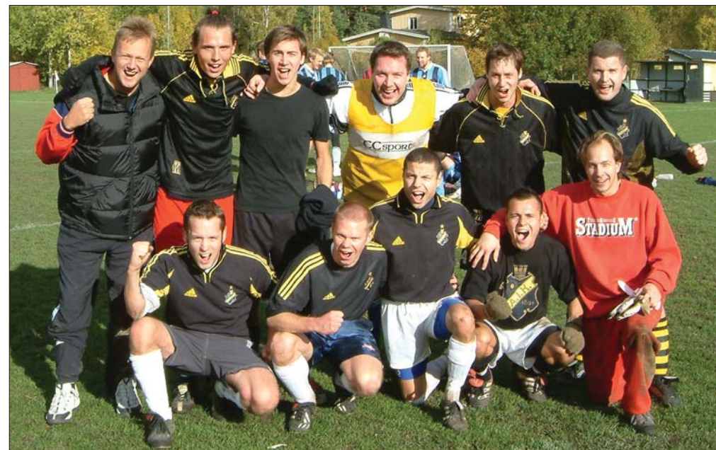
STORSEGRARNA I LILLA VIKING CUP 2003: AIK.