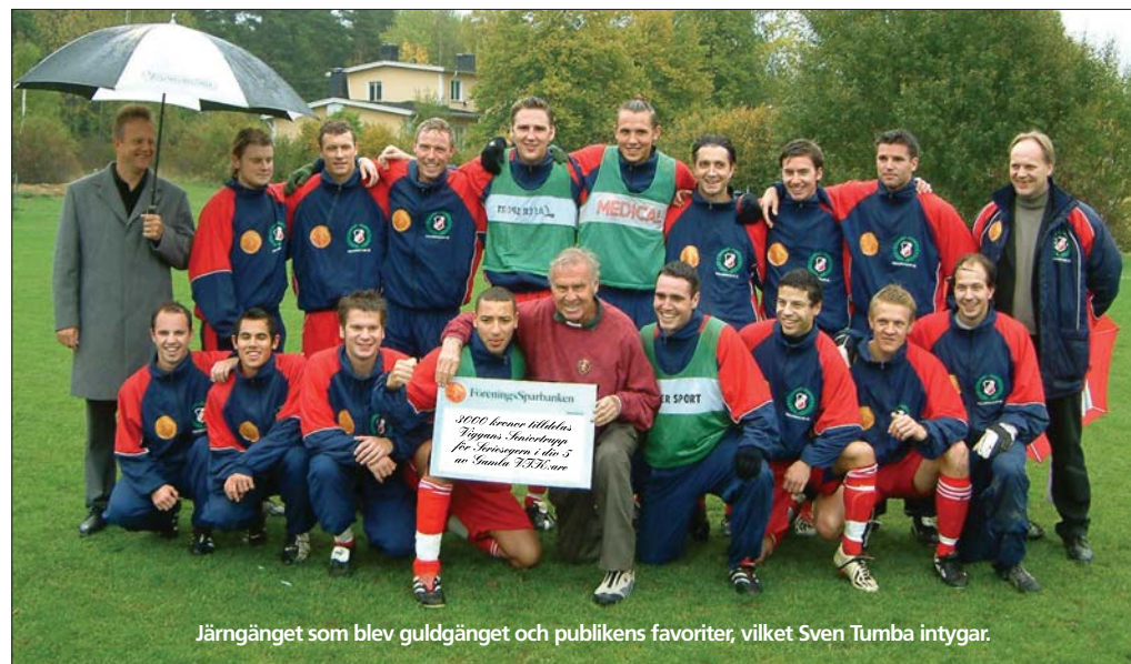
Järgänget som blev guldgänget och publikens favoriter, vilket Sven Tumba intygar.

Lördagen 4 oktober, 2003 En timme innan matchstart öppnade Sankte Per gylfen och lät det skvala för den återstående delen av lördagen. Trots denna ovälkomna påhälsning uppifrån så letade sig inte mindre än 103 personer ner till Hägernäs för att få se sina idoler i aktion. Inte nog med det, de fick se Sven Tumba dela ut en gratifikation på 3000 kr från Supporterklubben.