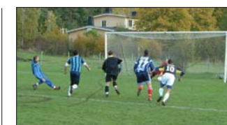
Nordine missar straffen mot AIK