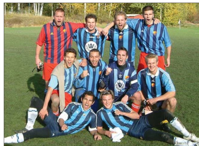
SILVERMEDALJÖRERNA I LILLA VIKING CUP 2003: DIF.