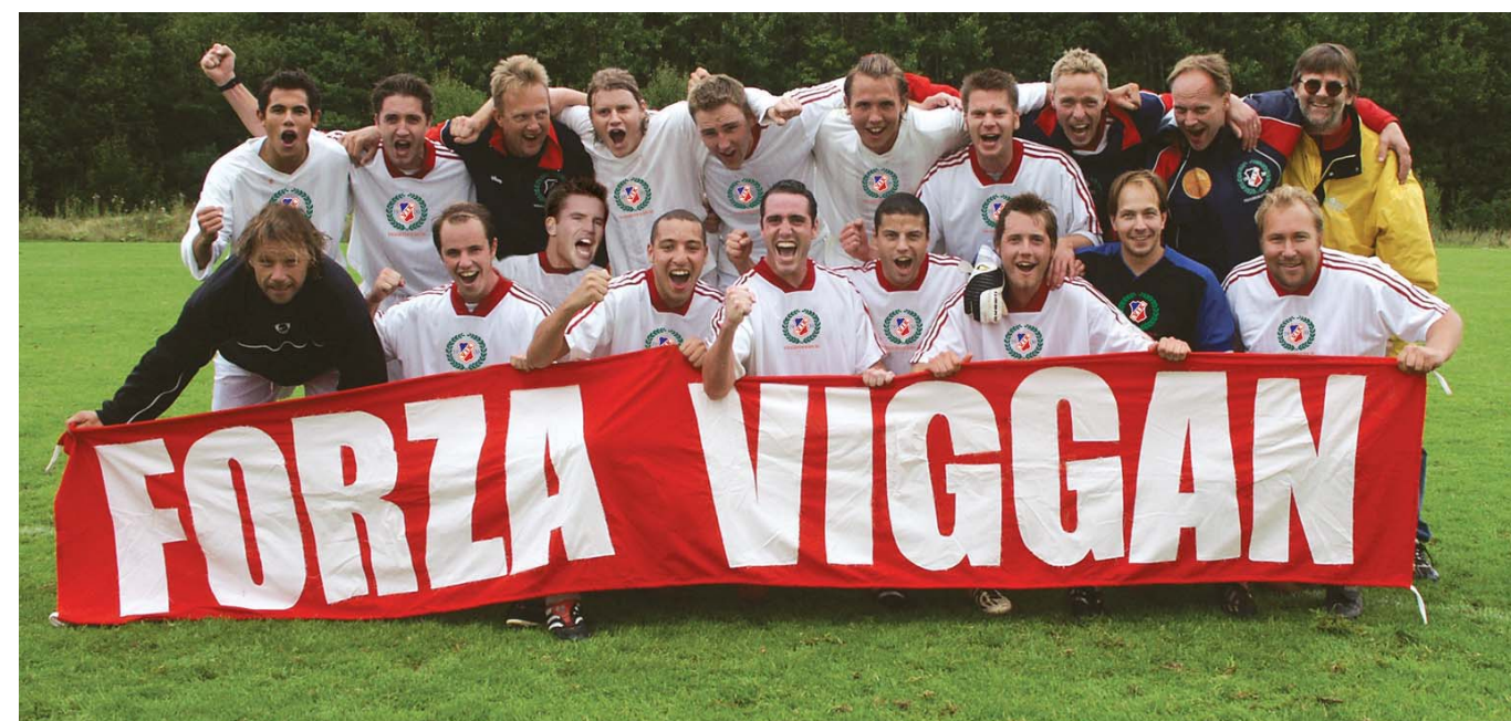
Viggbyholms IK · Serieegrare i div 5 N, 2003