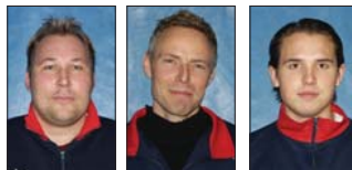
MoDo Wella Honken

Grabbarna ovan kommer att fungera som Gauleiters på lördag när det gäller att se till att utdelningen kommer att gå som flott i en stekpanna. Vidare är det till dessa herrarna som ni skall lämna in alla era tips. Det lag som lämnat in flest tips kommer att bjudas på bira av Gula Örnen på Bruket. Här räknas då den tipskoefficient, som utgår ifrån hur många tips som lämnats per gubbe. Lag med högsta tipskoefficient kommer att vinna.