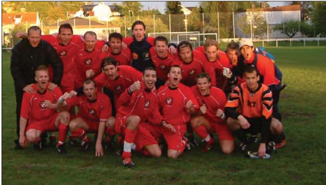
Aaarå, nu sitter leendena där igen efter 6-1 segern mot Bromsten.

Efter debutet den 15 maj styrdes nu kosan mot Bromstens IP och en väntande motståndare, vars början i serien inte hade bjudit på några höjdpunkter. Det förelåg därför vissa farhågor om en latent, omedveten underskattning.