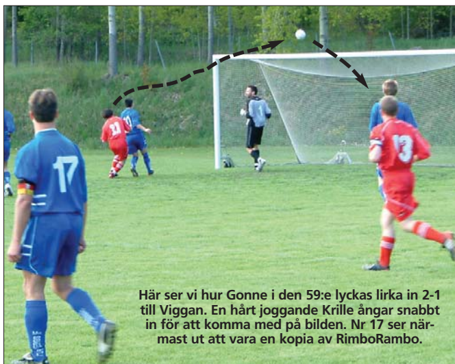
Här ser vi hur Gonne i den 59:e lyckas lirka in 2-1 till Viggan. En hårt joggande Krille ångar snabbt in för att komma med på bilden. Nr 17 ser närmast ut att vara en kopia av RimboRambo.

Bilagan har nu på fem matcher skrapat ihop tre vinster och en oavgjord, samt en förlust som vi får se som olycksfall i arbetet. Detta gör att man, utifall man skulle vinna hängmatchen mot Roslagskulla, skulle gå upp i ensam ledning i R2:an. När hände det sist?