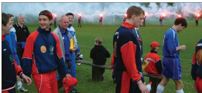
Ännu anar ingen oråd även om vissa verkar mer sammanbitna än andra.

Dessvärre var gästerna ofina nog att inleda matchen med ett otal frilägen, av vilka HP bl a enhandsräddar ett i den 11:e. Alla förstod att det inte skulle kunna hålla i läng-