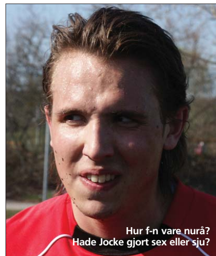
Hur f-n vare närå? Hade Jocke gjort sex eller sju?

Ni har alla gjort en megaprestation så här långt och visat, att trots att vi är nykomlingar, så går det faktiskt att rubba gamla etablissemang. Även om publiken nu har vant sig vid att det svänger om Viggan, så vore det trevligt om vi kunde hålla tätt bakåt på måndag. Det skulle liksom kännas lite bättre för alla som har en orolig mage, till vilka redaktionen kan hänföras. □