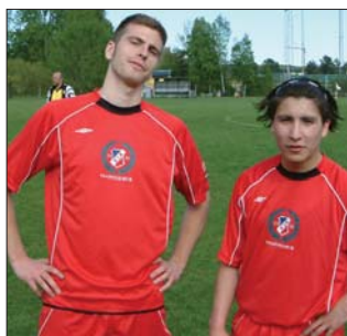
Webbo och Gonne, två stolta fasantuppar, som lyckades peta in varsitt mål för Bilagan.

Han med den saftigaste plymen, Gonne, får i den 59:e ett fint tillfälle att visa att han inte bara snackar om att han kan göra mål - han gör det också, varvid det blir 2-1.