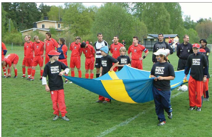
Flaggan var inte riktigt i topp när slagskeppet Viggbyholms IK sänktes förra lördagen av Turebergstorprederna. Vi hoppas dock att den vid nästa hemmamatchen åter skall lysa mot en klarblå himmel.

Lördagen 15 maj torskade vi hemma med 2-7 mot Tureberg, för att i onsdags 19 maj vinna med 6-1 mot Bromsten. Ibland undrar man när Bollnäs och Edsbyn skall dyka upp i serien. Nu har vi spelat 8-8 på två matcher, vad händer mot Hässelby?