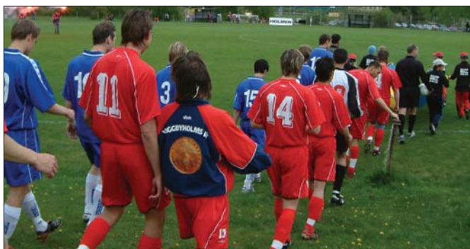
Helt oanande om vad som väntar, tågar man glatt ut på planen.

Inte sedan runstenen invigdes den 13 maj 2000, hade det varit så mycket folk på Hägernäs IP. Mer än 350 personer hade tagit sig ned för att dels beskåda Ungdoms-