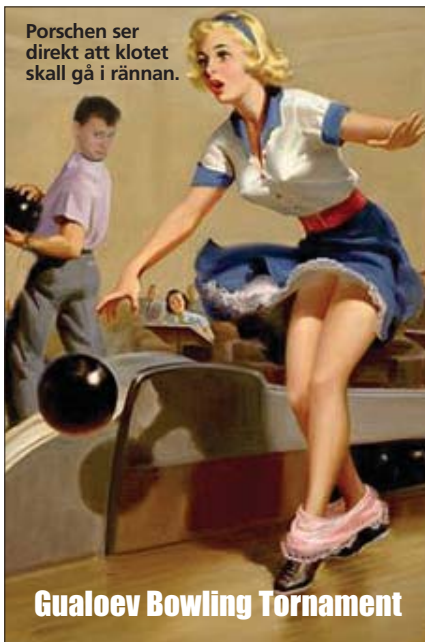
Porschen ser direkt att klotet skall gå i rännan.