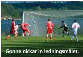
Gonne nickar in ledningsmålet.

Peratten, som blåste liv i matchen 17.00, fick redan efter 8 minuter skåda huru Brisse var nära att måla på en Gonnehörna. Brisse tackar Gonne genom att i den 12:e nicka tillbaka, dock inte samma boll, vilket Gonne använder sin nyklippta lugg till att nicka in 0-1.