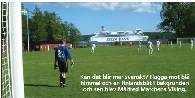
Kan det blir mer svenskt? Flagga mot blå himmel och en finlandsbåt i bakgrunden och sen blev Målfred Matchens Viking.

Gonne, som nu ser lite bättre (ut), efter klippningen, skottar även in 0-2 i öppet mål, sedan Porschen serverat en perfekt passning. Att sen Kullorna fick 1-2 i den 44:e