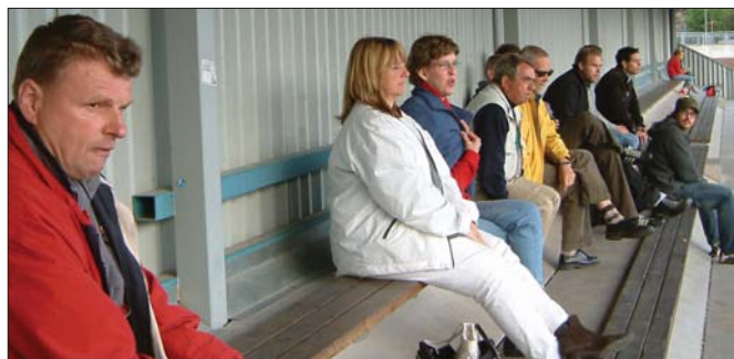
Sammanbiten satt den, Vigganklacken, som i ur och skur åker runt för att försöka få se mål och poäng som man sedan kan ta med sig hem.

Det här var inte ens i närheten av vad vi på läktaren hade hoppats på. En riktig överhaling var på gång om