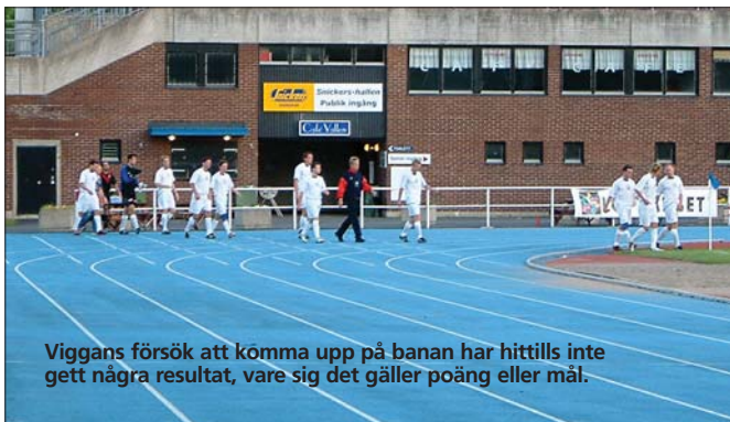
Viggans försök att komma upp på banan har hittills inte gett några resultat, vare sig det gäller poäng eller mål.

För tredje matchen i rad utgår vi mållösa från planen. Nu tar vi sommaren till hjälp och laddar för fullt och vänder på feberkurvan under höstsäsongen.