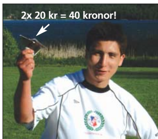
Gonne tjänade storkovan mot Kulla. Gula Örnen fick punga ut med 40 spänn för målkalaset. Men det var det värt!

kom igen, men det räckte inte till några poäng den här gången. Målfred höll tätt. □