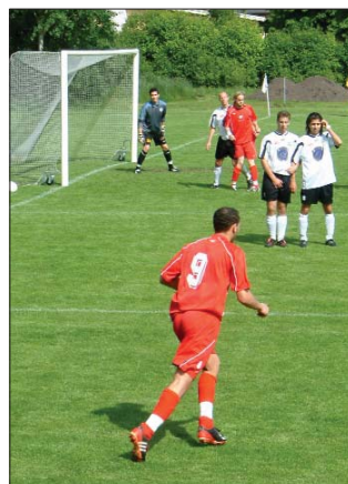
Barakas lägger frispark mot Brisse

Matchen avslutas sedan med att Brisse i den 40:e på en hörna nickar just över.