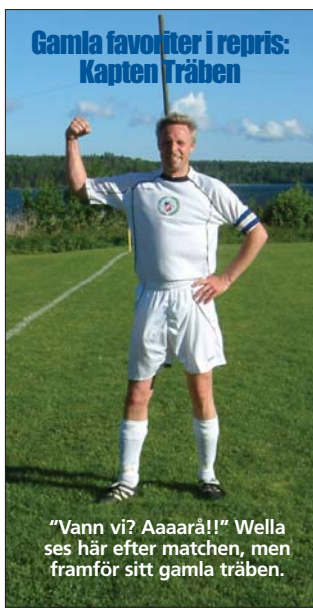
Gamla favoriter i repris: Kapten Träben

Dubbelösskan slog en dubbelknut på sig själv då han