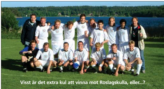
Visst är det extra kul att vinna mot Roslagskulla, eller...?

Bilagan gjorde vad som förväntades och vann.