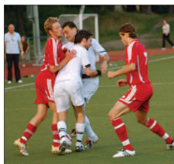
Tuffa tag i matchen mot Djurgårdsbrunn.